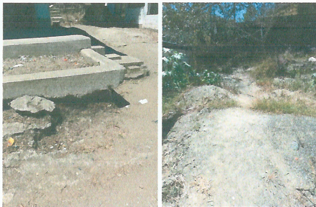
Foto 3: Area donde se desea el mejoramiento de loza de patio en el nivel primaria