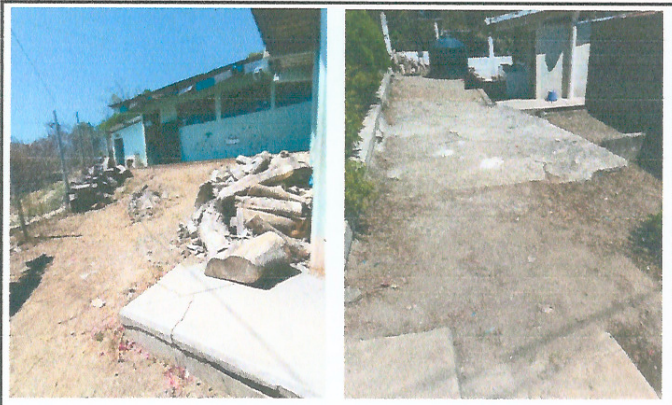
Foto 2: Area donde se desea el mejoramiento de loza de patio en el nivel preprimaria