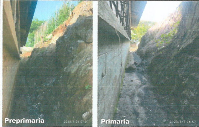
Foto 1: Imagen en donde se desea realizar el mejoramiento del muro de contención en área de preprimaria y primaria debido a peligro por deslave